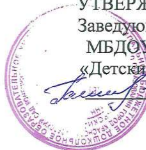
График работы специалистов консультационного центра «АИСТ» (по предварительной записи)